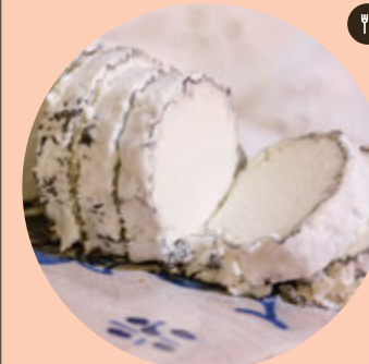
Queso Artesanal de Cabra

La leyenda cuenta que, al paso de la corte real por la localidad, los vecinos de Azambuja ofrecieron a los nobles sus queijadinhos, una delicatessen que se popularizó y se fue reinventando. Se trata de un trampantojo que no lleva queso ni leche. Con una base de hojaldre, su singular y delicado sabor procede del relleno: dulce de huevo con almendra.