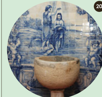
Iglesia Parroquial de Santa Marta

En la orilla sur del Vale de Azambuja el mayor canal artificial de Portugal, los amantes de los deportes acuáticos encontrarán este amarradero. Un lugar perfecto para admirar la belleza del paisaje ribereño, marcado por la presencia de la antigua casa de la Companhia dos Canais (Palacio).