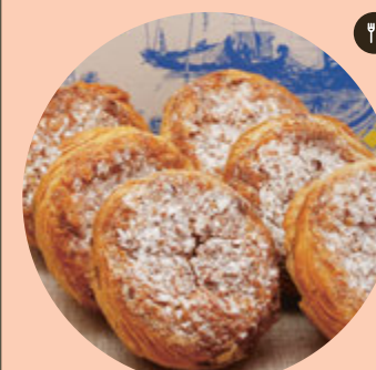
Queijadinhos de Azambuja

Consiste en la reutilización del pan duro combinado con aceite de oliva, ajo, sal y una hogaza adecuada, hasta convertirlo en un plato codiciado. De norte a sur de la comarca, el torricado es un imprescindible en la mesa y está presente en todas las cartas de los restaurantes locales.