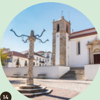
Iglesia Matriz de Nossa Senhora da Assunção y Pelourinho de Azambuja

En el corazón del pueblo de Azambuja se encuentran dos monumentos protegidos que hablan de un pasado de siglos. El Pelourinho y la Iglesia Matriz de Nossa Senhora da Assunção, un templo manierista de arquitectura chã, son dos lugares de visita imprescindible.