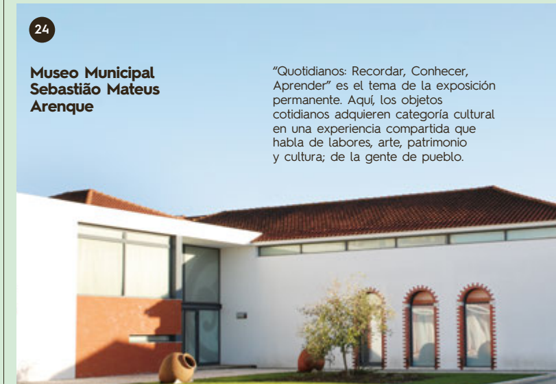
Museo Municipal Sebastião Mateus Arenque

No te pierdas las sardinas asadas, los conciertos, el fado callejero, las artesanías, las actividades ecuestres y las corridas. La Plaza das Freguesias es el lugar ideal para conocer la gastronomía local.