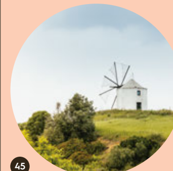
Molino de Maçussa

Los molinos de viento son hoy una imagen emblemática, herencia de la época en que la base de la alimentación era el pan.