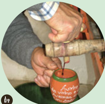
ÁVINHO - Fiesta del Vino y las Bodegas

Un viaje singular por el mundo del vino en un museo vivo en el que los viñedos y bodegas son espacios expositivos donde los productores comparten sus conocimientos orgullosamente.