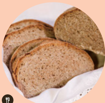
Pan de Trigo Barbela

Su ubicación fue sabiamente elegida e invita a la contemplación del paisaje rural y natural, desde los valles de la Ribeira de Maçussa hasta la imponente Sierra de Montejunto.