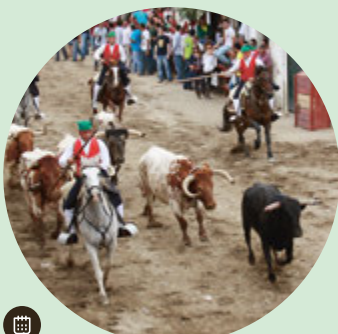
Feira de Maio (Feria de Mayo)

Tierra de gente recta, de tradiciones cuyos orígenes se pierden en las brumas de la historia y de costumbres influenciadas inevitablemente por la omnipresencia del Tajo, Ribatejo es un destino para descubrir a caballo. No hay mejor manera de conocer los secretos de la región que en un paseo a caballo lleno de tradiciones y en contacto con la naturaleza.