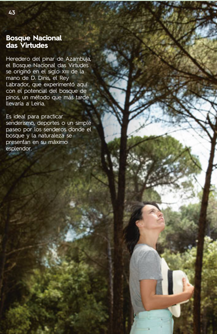
Bosque Nacional das Virtudes

Imponente sobre el paisaje, la antigua iglesia de Santa María de Alcoentre, documentada desde el siglo XIV, adquiere en el siglo XX el nombre de Nossa Senhora da Purificação en el lugar que ya acogió desde el siglo XIV la tumba monumental del primer señor de Alcoentre.