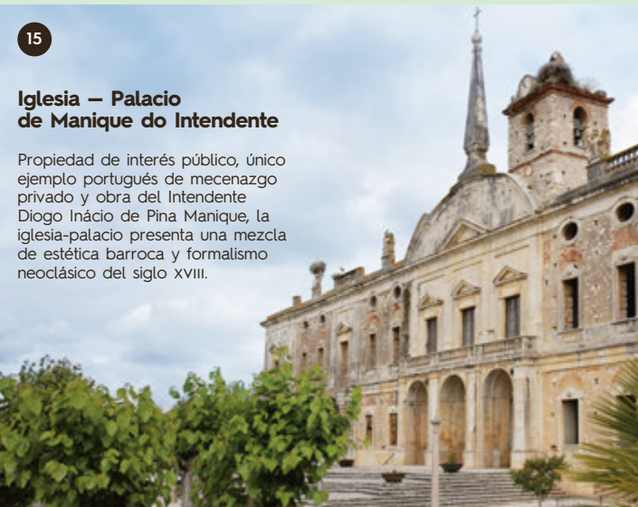
Iglesia - Palacio de Manique do Intendente

Es ideal para practicar senderismo, deportes o un simple paseo por los senderos donde el bosque y la naturaleza se presentan en su máximo esplendor.