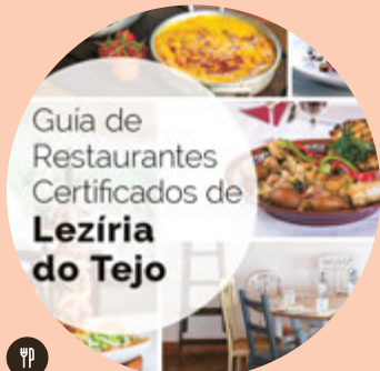
Sabores de Ribatejo

Las fincas de Azambuja y todo Ribatejo reunidas en una guía que explora los vinos del Tejo y las actividades enoturísticas.