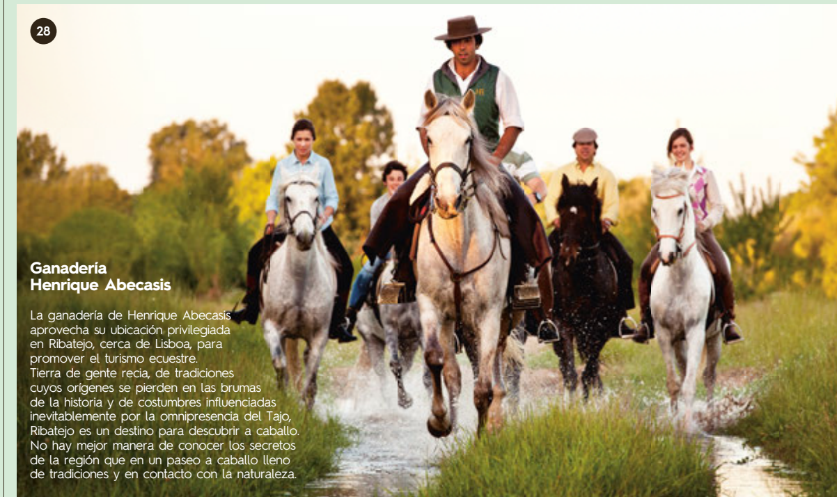
Ganadería Henrique Abecasis

El histórico encuentro entre João II y Cristóbal Colón en Vale do Paraíso tiene en este espacio un singular monumento y un recorrido museológico con el tema "El mundo moderno también comenzó aquí en el siglo XV". La interpretación y representación del mundo a través de la cartografía es aquí una invitación al conocimiento que abarca diferentes momentos de la historia mundial: desde la antigüedad hasta el día de hoy.