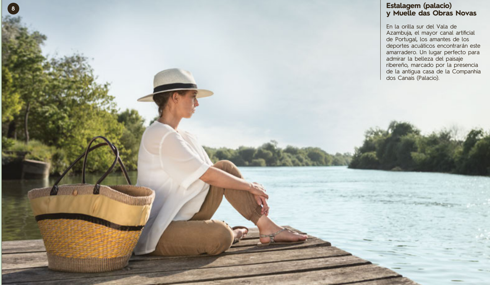
Estalagem (palacio) y Muelle das Obras Novas

Propiedad de interés público, único ejemplo portugués de mecenazgo privado y obra del Intendente Diogo Inácio de Pina Manique, la iglesia-palacio presenta una mezcla de estética barroca y formalismo neoclásico del siglo XVIII.