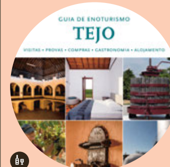
Vinos del Tejo

Aquí ha renacido la producción de trigo Barbela, un trigo tradicional, con menos bayas por espiga, pero rico en nutrientes, de color oscuro y sabor lleno de personalidad.