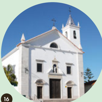
Iglesia Matriz de Nossa Senhora da Purificação

En el corazón del pueblo de Azambuja se encuentran dos monumentos protegidos que hablan de un pasado de siglos. El Pelourinho y la Iglesia Matriz de Nossa Senhora da Assunção, un templo manierista de arquitectura chã, son dos lugares de visita imprescindible.