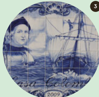
Casa Colombo, Centro de Interpretación

Su belleza interior es impactante por el conjunto de paneles de azulejos que representan la vida de Santa Marta. No dejes de admirar las fabulosas vistas del mirador sobre la lezíria y el Tajo.